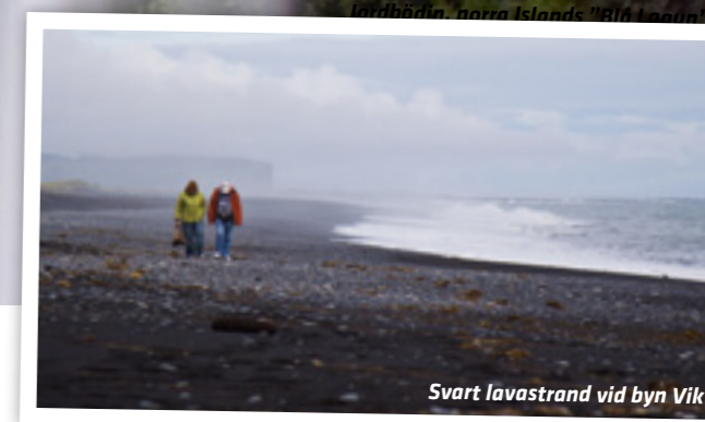
Svart lavastrand vid byn Vik

Vi inleder dagen med att passera lavafälten i Eldhraun och betrakta de svarta glaciärdynerna i Myrdalssandur. Vi kommer fram till Dyrhólaey via Reynisfjara, Islands sydligaste punkt som bland annat är känd för sin lunnefågelkoloni. I Skógar besöker vi Skógar museum. Vi stannar till vid vattenfallen Skógafoss och Seljalandsfoss. Därefter fortsätter vi via Hella och Hvolsvöllur till Selfoss. Övernattning och middag på det utmärkta Hotel Selfoss. (Detta hotell har ett mycket trevligt SPA som vi varmt rekommenderar.)