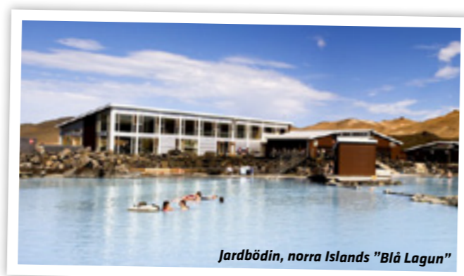
Jarðbödin, norra Islands "Blå Lagun"

kan vi studera i Dimmuborgir, pseudokrater och undervattensgrottor med geotermiskt vatten finns i Grjótagjá, ångeruptioner och kokande svavelgropar får vi se vid besöket i Námaskarð. Vi stannar till vid Jarðbödin, norra Islands "Blå lagun" där det finns möjlighet att bada (+180 kr/person) och äta lunch. Övernattning och middag på Hotel KEA i Akureyri.