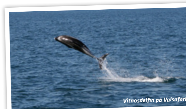
Vitnosdelfin på Valsafari

Vi spanar efter valar i Faxaflói utanför Reykjavik. Vi kan t.ex. se späckhuggare, vikval, puckelval, delfiner. Ombord på båten finns kiosk, bar och förfriskningar. Chansen att se val är 99 %. (i de unika fall vi inte ser val, erbjuds en gratis tur samma dag eller senare i veckan.) Det finns även god chans att se lunnefågel på denna tur. Utflykten avgår från Reykjaviks hamn flera gånger om dagen. Du väljer själv vilken tid som passar dig bäst. På denna utflykt ingår ingen transfer från hotellet eftersom vi avgår från Reykjaviks hamn. Vi föreslår en promenad. Från våra hotell är det ca 10-25 minuters promenad till hamnen.