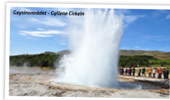
Geysirområdet - Gyllene Cirkeln

i Geysirområdet i Haukadalur. På hemvägen kommer vi till det forna biskopssätet i Skálholt och besöker växthusbyn Hveragerði där allt odlas med hjälp av jordvärme. Det finns möjlighet att äta lunch på denna tur.